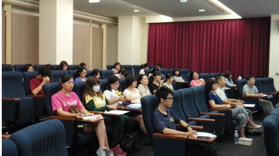
活動照片 -3(活動海 報)