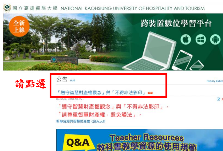
圖一 本校 ee-learning 平台網站首頁公告

建議廠商提供授課教師的課堂簡報資料仍需先取得作者或出版社的授權許可，始得為之。上述相關 Q&A 業已公告至本校 ee-learning 平台網站首頁/公告/「遵守智慧財產權觀念」與「不得非法影印」，請參閱下圖一與圖二。